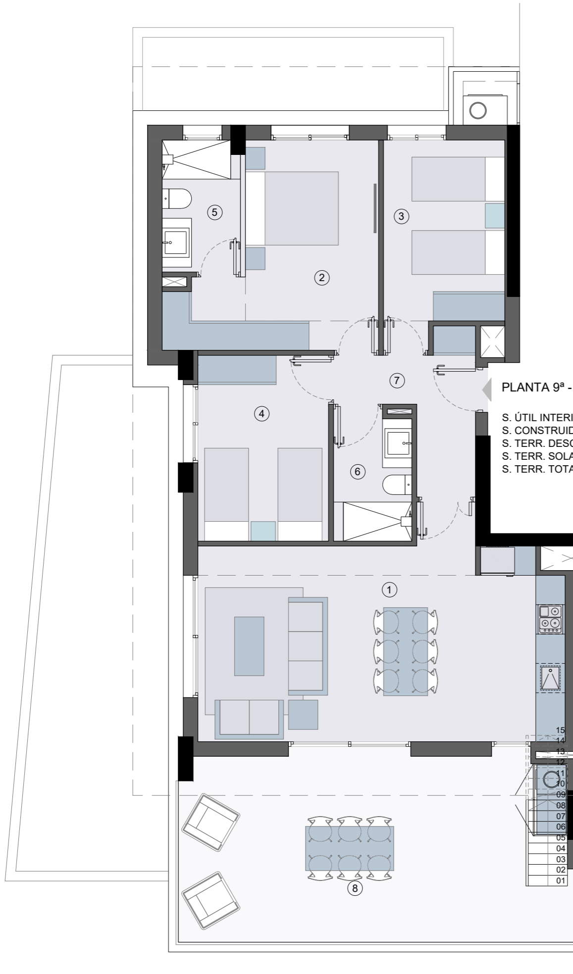
PLANTA 9ª - TIPO A3

S. ÚTIL INTERIOR.: 79,36 m 2 S. CONSTRUIDA: 97,95 m 2 S. TERR. DESCUB.: 31,37 m 2 S. TERR. SOLARIUM.: 112,79 m 2 S. TERR. TOTAL: 144,16 m 2